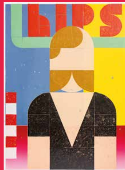
AUFSTELLUNG-BERLIN NEUKOELLN 2013, Hochdruck, Handabzug, 59,6 x 43,8 cm.

Anmeldung zu Veranstaltungen und Workshops sowie für Schulklassen im Museumssekretariat unter museen@kornwestheim.de oder Tel. 07154-202-7401.