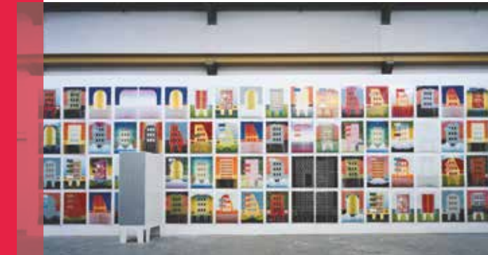
MODUL HAUS STADT 2008, Installationsansicht, 70 Holzschritte à 107 x 76 cm, Kamera, begehbares Objekt, 5 x 16 m.