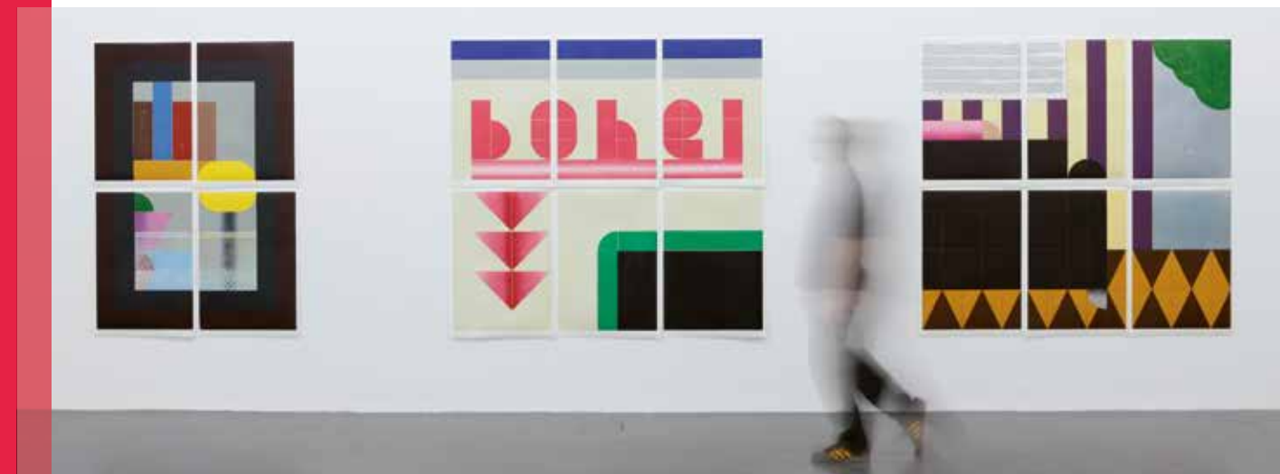
STUDIOANSICHT Tagesschau I, Hochdruck, 4-teilig, 200 x 140 cm, 2011, Bohei, Hochdruck, 6-teilig, 200 x 210 cm, 2011. Interieur (Untermalung rot), Hochdruck, 6-teilig, 200 x 210 cm, 2011.

Als interaktives Highlight wird eine App auf Tablets oder dem eigenen Smartphone angeboten. Mit dieser App kann man anhand von einfachen geometrischen Formen ein eigenes Kunstwerk kreieren, es als jpeg-Datei speichern oder vom Künstler als originalgrafischen Druck anfertigen lassen.