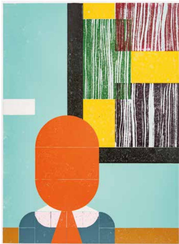
AUFSTELLUNG-MUSEUM 2013, Hochdruck, Handabzug, 59,6 x 43,8 cm.

Mich interessieren menschliches Miteinander, Selbstwirksamkeit, Scheitern und Schönheit, und all die Zwischenräume, in denen unbemerkt Neues heranwächst.