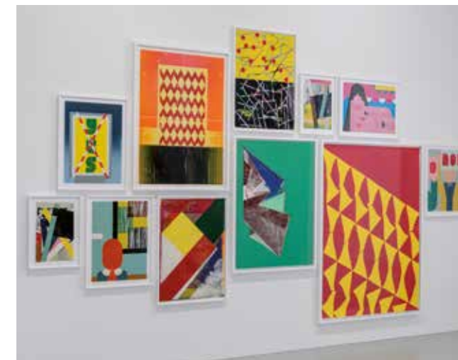
CLUSTER IV 2018, Installationsansicht Sprengel Museum Hannover, 11 Hochdrucke, verschiedene Größen, 2008–2017. Besitz: Sammlung Sprengel Museum Hannover.