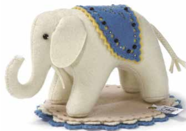
STEIFF ELEFÄNTLE Nadelkissen, 1880 von Margarete Steiff entworfen, Replik von 1984, Steiff Museum, Giengen an der Brenz