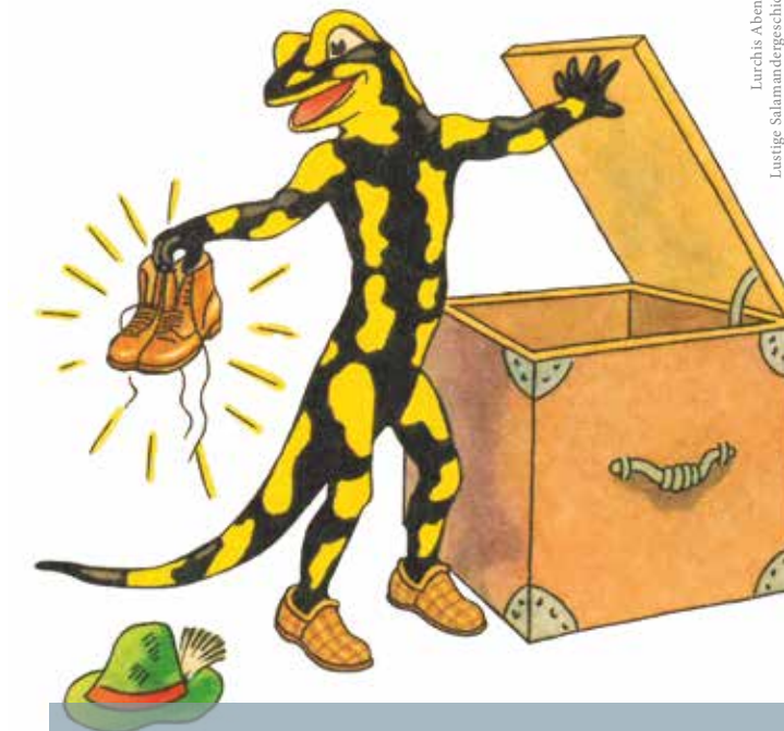
Lurchis Abenteuer Lustige Salamandergeschichten 1. Folge - Wiederauflage 1951, S. 1, Detail.

Kostenlose Tiefgarage P6 Kulturkarree S-Bahn-Anbindung mit S4 und S5