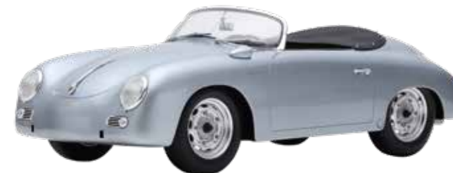
PORSCHE 356 SPEEDSTER Modell 1:12, 1954, Unternehmensarchiv Porsche AG, Stuttgart-Zuffenhausen

Anmeldung zu Veranstaltungen und Workshops sowie für Schulklassen im Museumssekretariat unter Tel. 07154 202-7401