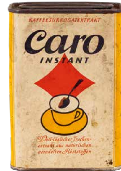
CARO INSTANT Kaffeedose der Firma Franck, 1950er Jahre, Stadtgeschichtliche Sammlung Kornwestheim