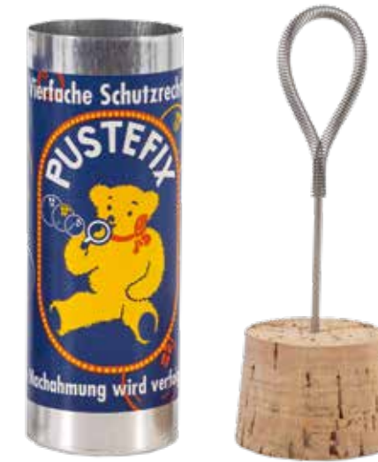
PUSTEFIX-SEIFENBLASEN Dose mit Korkverschluss, 1950er Jahre, Firmenarchiv der Pustefix GmbH, Tübingen