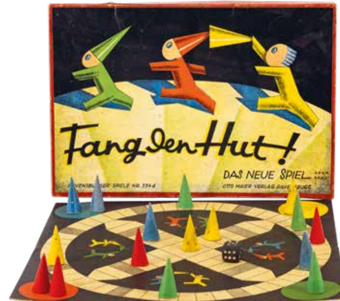
FANG DEN HUT Spiel aus dem Hause Ravensburger, 1940er Jahre, Stadtgeschichtliche Sammlung Kornwestheim

Diese und viele weitere Exponate füllen die Ausstellungsfläche und ermöglichen einen nostalgischen Rückblick auf die eigene Kindheit. Abhängig von Alter und Herkunft der Besucher*innen, wird der Gang durch die Ausstellung für manche zur Zeit-, für andere zur Entdeckungsreise.