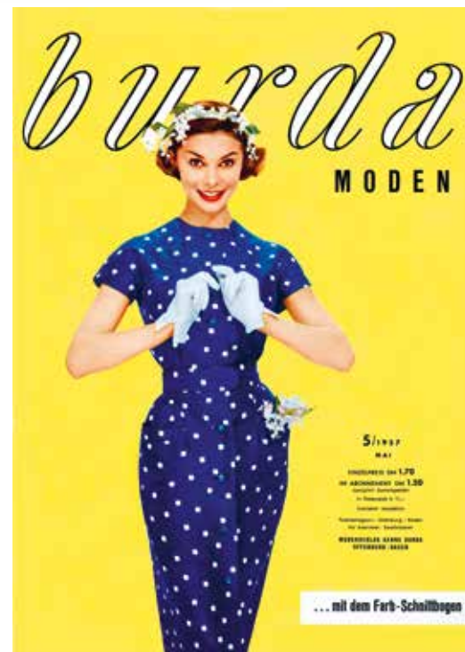
BURDA MODEN Modezeitschrift, 1957, Verlag Aenne Burda, Offenburg

Baden-Württemberg, seine Menschen und Unternehmen haben im Laufe der Zeit viele Produkte mit Kultstatus hervorgebracht. Sie sind nicht nur Aushängeschild des Bundeslandes, sondern prägten und prägen mehrere Generationen.