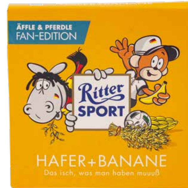
ITTER-SPORT SCHOKOLADE ÄPFLE & PFERDLE EDITION 2016, Stadtgeschichtliche Sammlung Kornwestheim