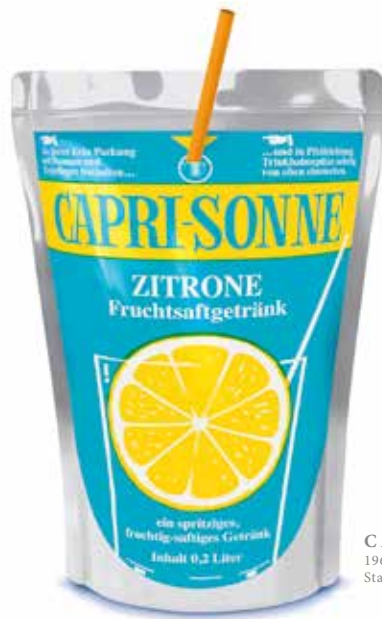
CAPRI-SONNE 1969, Replik zum 50. Jubiläum aus dem Jahr 2019, Stadtgeschichtliche Sammlung Kornwestheim