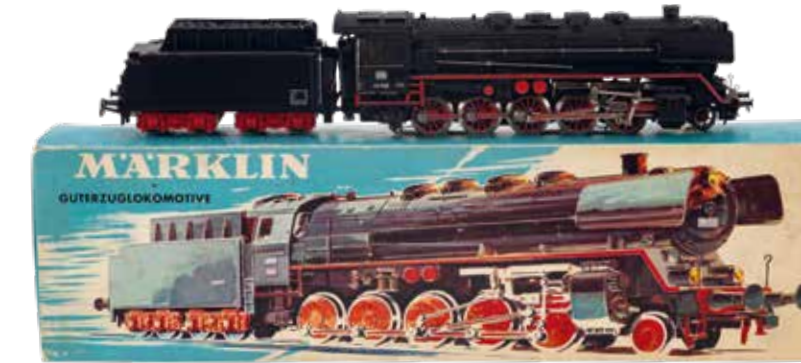
MÄRKLIN GÜTERZUGLOKOMOTIVE Modell 3047 nach BR 44 der DB, um 1970, Stadtgeschichtliche Sammlung Kornwestheim