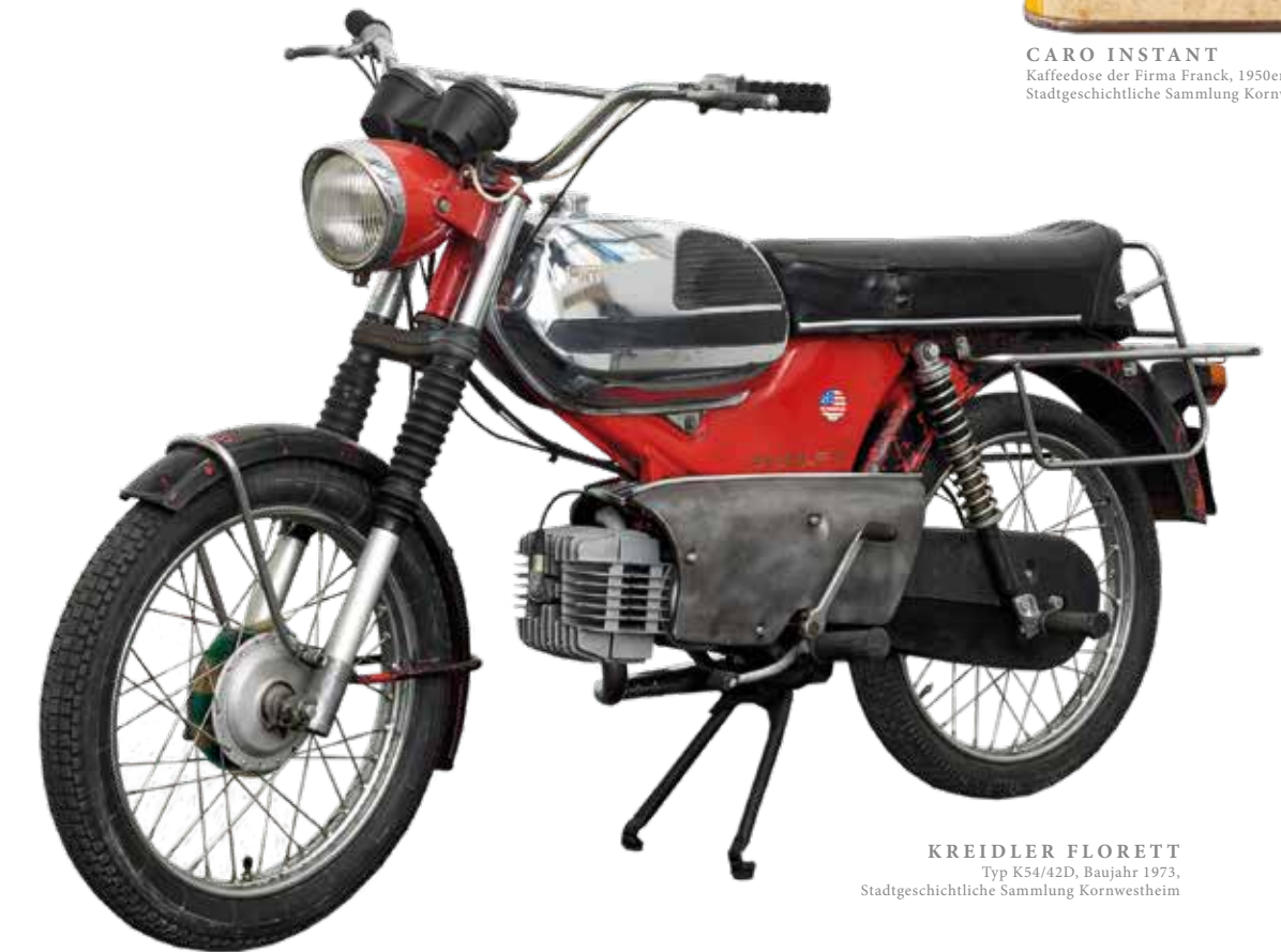
KREIDLER FLORETT Typ K54/42D, Baujahr 1973, Stadtgeschichtliche Sammlung Kornwestheim