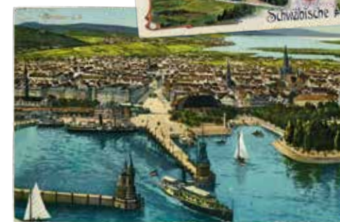
HISTORISCHE ANSICHTSKARTEN Heidelberg, Konstanz und Schwäbische Alb, 1900–1925, Farblithografien, ca. 10,5 x 14,8 cm