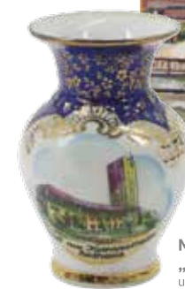
MINIATURVASE „GRUSS AUS KORNWESTHEIM“ , um 1930, Porzellan, MPK Bavaria, 8 x 5,5 cm

Anmeldung für Schulklassen im Museumssekretariat unter museen@kornwestheim.de oder Tel. 07154-202-7401.