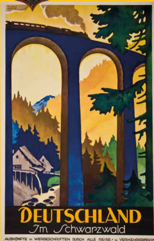
AUSKUNFTE u. WERBESCHRIFTEN DURCH ALLE REISE u. VERKEHRSBÜROS