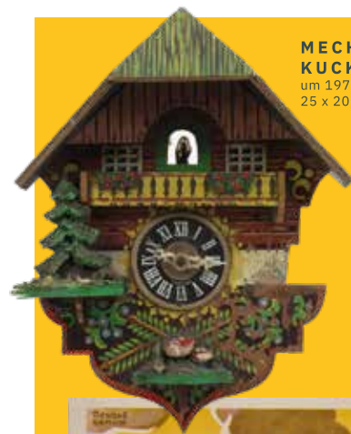
MECHANISCHE KUCKUCKSUHR um 1970, Holz, bemalt, 25 x 20,5 x 11 cm