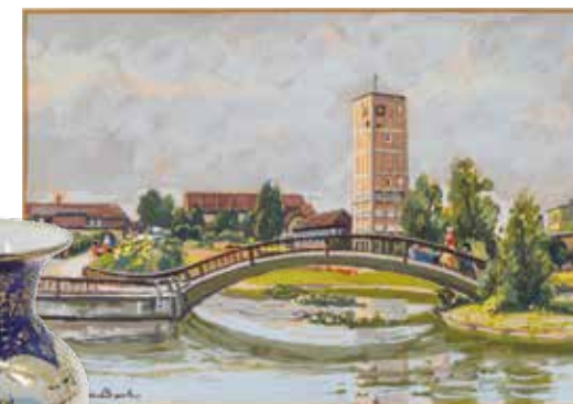
OTTO HOFER-BACH Rathaus Kornwestheim mit Parkbrücke, o.J., Tempera auf Papier, 38,3 x 45,9 cm