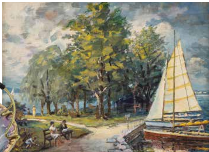
RICHARD KIWIT Promenade am Bodensee, o.J., Mischtechnik auf Hartfaserplatte, 39 x 51,5 cm