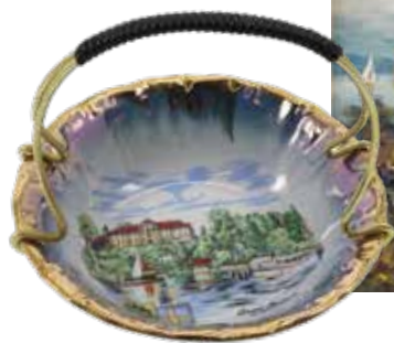
SERVIERTELLER Insel Mainau am Bodensee, Hersteller: Winterling Schwarzenbach, 1970er- Jahre, Porzellan, vergoldet, 12 x 13 cm

Maria Caspar-Filser Johann Dannemann Oskar Frey Manfred Henninger Otto Hofer-Bach Lothar Hörer Albert Kappis Richard Kiwit Christian Landenberger Alfred Lehmann Bernhard Pankok Jakob Plankenhorn Hermann Pleuer Robert Poetzelberger Otto Reiniger Alois Schenk Oskar Schlemmer Gustav Schönleber Erwin Starker Walter Strich-Chapell Adalbert Sutor Hermann Umgelster Roland Wesner