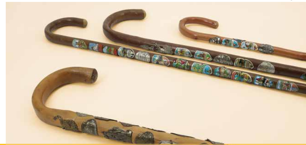
WANDERSTÖCKE MIT STOCKNÄGELN 1940-1970, Holz, Metall, verschiedene Größen, Privatsammlung und Archiv des Schwäbischen Albvereins, Stuttgart