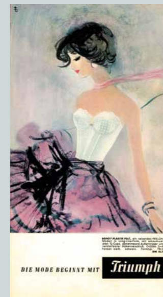
LILLO RASCH-NAEGELE Dame mit Korsage, Werbung für Triumph, um 1958

Mit einem bemerkenswerten Selbstverständnis zur Rolle der Frau in Gesellschaft und Beruf treten die Werbeartikel oftmals in den Hintergrund und geben die Sicht frei auf das mit der Ware transportierte Lebensgefühl. Die Frau in der glücklichen, traditionellen Familie ist dabei ebenso ein Merkmal ihrer Grafikentwürfe wie die selbstbewusste Lebedame, die ihre Interessen nach Luxus und Genuss ausrichtet.