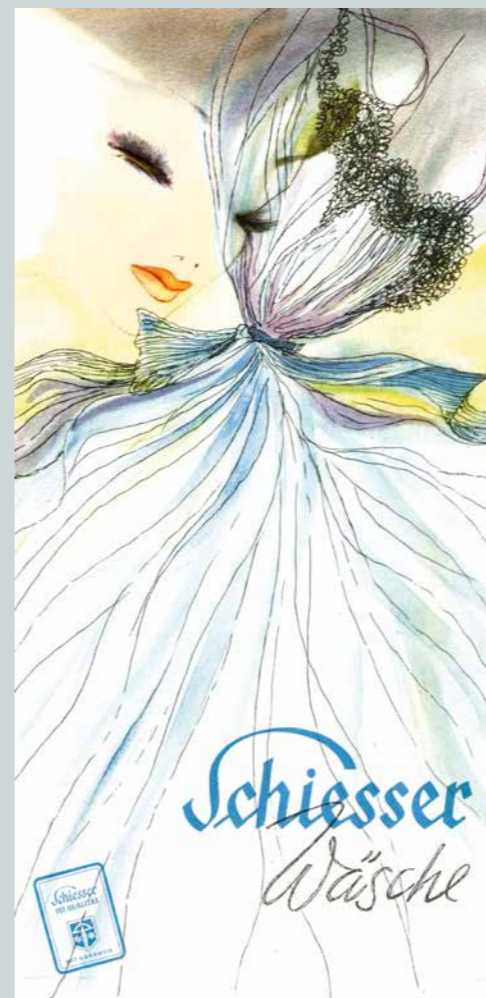
LILLO RASCH-NAEGELE Ein Traum von Wäsche, Werbung für Schiesser, um 1953

Lilo Rasch-Naegeles (* 1914 in Stuttgart, † 1978 in Leinfelden-Echterdingen) Werbefabriken für Daimler-Benz, Triumph, Salamander und andere namhafte Firmen verschaffen den Betrachterinnen und Betrachtern mit ihrer Schönheit und Eleganz einen Zugang zu verborgenen Welten.