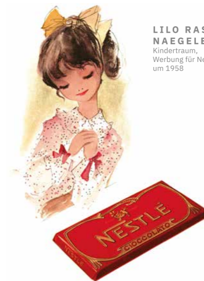
LILO RASCH- NAEGELE Kindertraum, Werbung für Nestlé Schokolade, um 1958