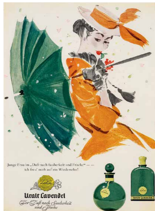
OTTO GLASER Dame mit Schirm, Werbung für Uralt Lavendel, 1951

Otto Glasers (* 1915 in Basel, † 1991 in Lugano) Plakate für die Salamander AG, die zwischen 1958 und 1968 für das Kornwestheimer Unternehmen entstanden sind, nehmen einen herausragenden Platz im Oeuvre des Künstlers ein.