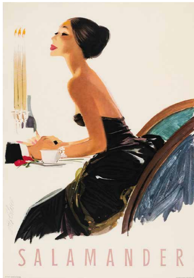
OTTO GLASER Dame in Schwarz, Werbepublikum für Salamander, 1957

Schuhe erscheinen auf den Plakaten selten, vielmehr vermitteln die Grafiken einen eleganten und modebewussten Blick auf die damalige Zeit und auf eine Bilderwelt, die man eher in Paris als in Süddeutschland verorten würde. Die unbeschwertere künstlerische Herangehensweise verleiht den Motiven eine große Leichtigkeit. Seine mit raschem Pinsel ausgeführten Modezeichnungen für die Zeitschrift „Inspiré“ lassen Otto Glasers unvergleichliches Talent erkennen.