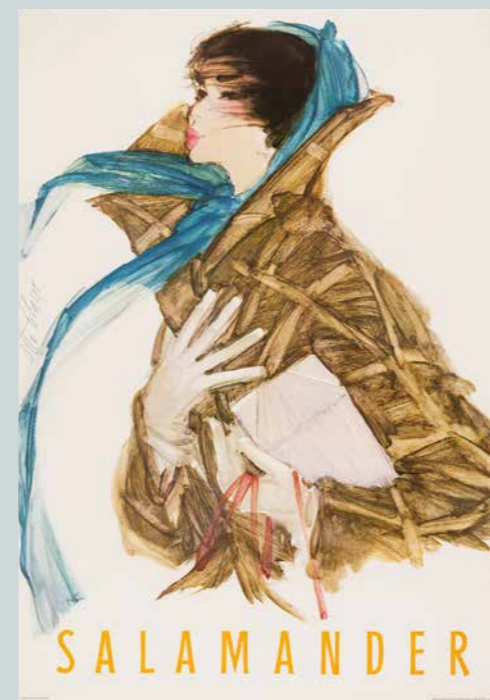
OTTO GLASER Dame mit blauem Schal, Werbung für Salamander, 1960

Anmeldung zu Veranstaltungen und Workshops sowie für Schulklassen im Museumssekretariat unter museen@kornwestheim.de oder Tel. 07154-202-7401.